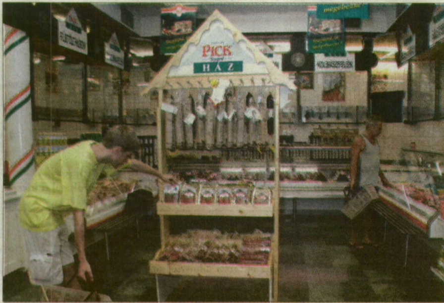
A Pick márkaboltja. A jövő a meghatározó tulajdonos kezében van.

Az Arago mérlegfőösszege az elmúlt évben 14,7 milliárd forintot ért el, a cég adózott eredménye tavaly 94 millió forint, egy esztendővel korábban 1,35 milliárd forint (!) volt. A társaság szeptember elején kezdte meg elmúlt évi eredményéből az osztalékfizetést, a záró hónap 2002 szeptember. Az Arago közgyűlése még áprilisban határozott arról, hogy a törzs-, szavazatszámossági és kamatozó részvények névértékére vetítve ötszázalékos, vagyis ötvenforintos, az osztalékelszámossági részvényekre háromszázalékos, harmincforintos osztalékot fizet. A közlemény felhívja a figyelmet arra, hogy a névre szóló részvények tulajdonosai közül osztalékra csak azok jogosultak, akik az osztalékfizetés kezdő időpontjához a társaság részvénykönyvében tulajdonosként szerepelnek. Akik nincsenek bejegyezve, azok még szeptember 3-ig a társaság székhelyén bejegyeztethetik magukat. (Mint ismeretes, a Pick legutóbbi éves rendes közgyűlésén olyan alapszabály-módosító javaslatot fogadtatott el az Arago, miszerint a közgyűlést a kifizetés időpontja előtt legalább 30