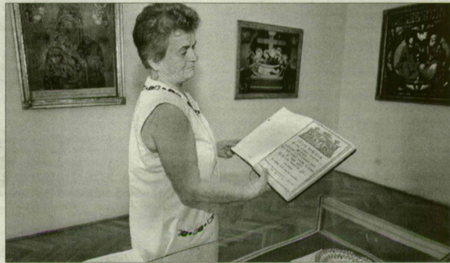
A British Museum is meg akarta vásárolni a vásárhelyi görögkeleti egyházközség ikonjait.