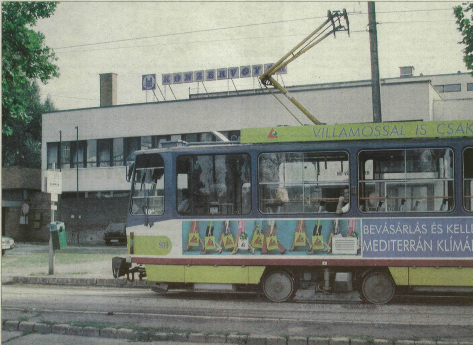
Már a villamos is csak rikán áll meg a konzervgyári megállóban.