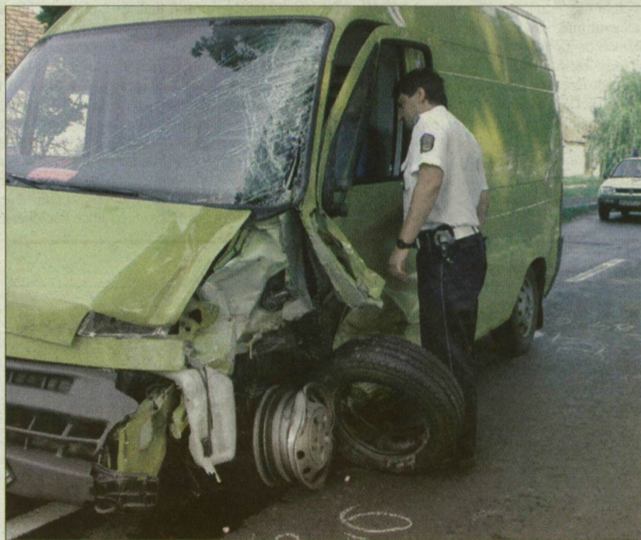
Kedden egy ember meghalt, tegnap nyolc megsérült az E75-ös út Szegedhez közeli szakaszain.