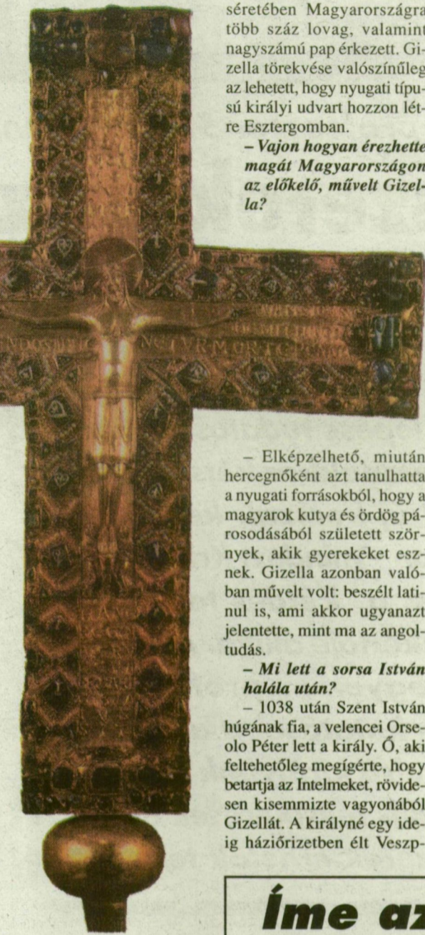
A Gizella-kereszt előoldala.

– Gizella a bajor királyi család leszármazottja volt, igen előkelő környezetben nőtt fel. Házassága Istvánnal a korszak egyik fontos dinasztikus szövetsége volt. A házasság voltaképpen bebiztosította a bajorokat a magyarokkal szemben. Gizella nagyapja, Ottó császár volt