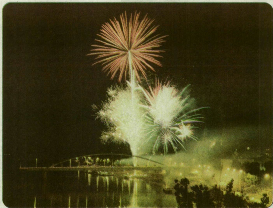
Ünnepi látványosság a szegedi Tisza-parton.

gol „Zöld Ember” onnan kapta nevét, hogy minden bemutatott előtt friss lombokat varrt ruhájára, így védekezve a lángok és a robbanások ellen. Az első igazi műsort 1572-ben tartották az angliai Warwick-kastélyban, I. Erzsébet királynő születés-