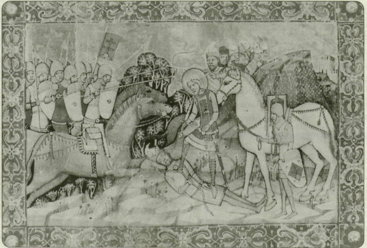
István győzelmet arat Keán bolgár vezér felett. Miniatura a Képes Krónikából

– A csatlakozás többet jelent, mint az illeszkedés. A csatlakozással Nyugat-Európa részévé vált volna Magyarország – ez a magyar fejlődésben soha nem valósult meg. István korában rendkívül erős modernizációs kísérlet zajlott le, amely magában foglalta a közigazgatás megszervezését, a vérsé-