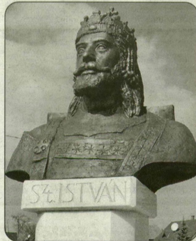
Szent István szobra Ruzsán.

gi alapú társadalom területi alapúvá válását, a földművelés meghonosítását, a tételes válásra való áttérést. Ennek ellenére Magyarországot óriási különbségek választották el Nyugat-Európától. István uralkodása az elit illeszkedési kísérlete, ami hozott ugyan eredményeket, de nem tartósakat. Ma sem tartanak bennünket Nyugat-Európa integráns részének.