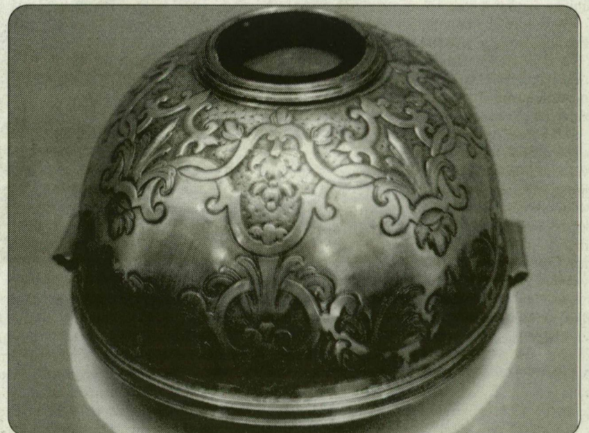
Szent István koponyaereklyéje.