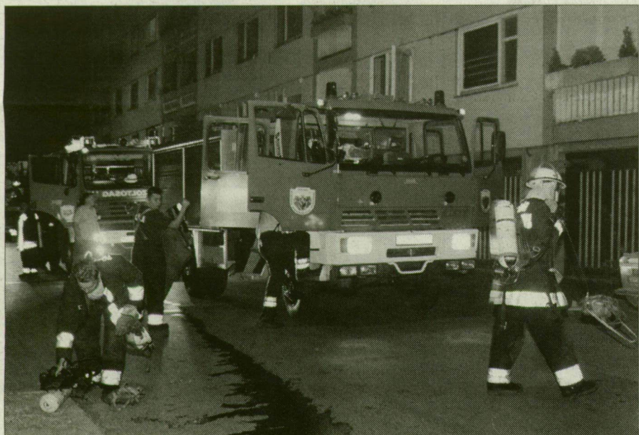
Hiába kerestek tüzet a Cső utcában a viccből riasztott tűzoltók.