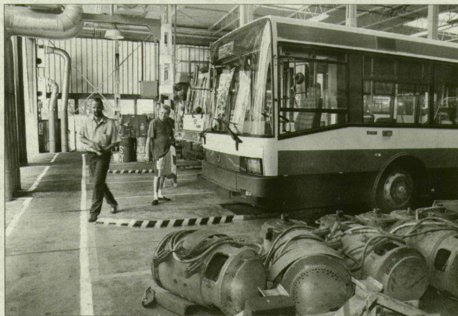
A Csáky József utcai telepen csinósítják a Skoda trolikat.

A háromajtós Skodák nem lesznek ismeretlenek a szege-