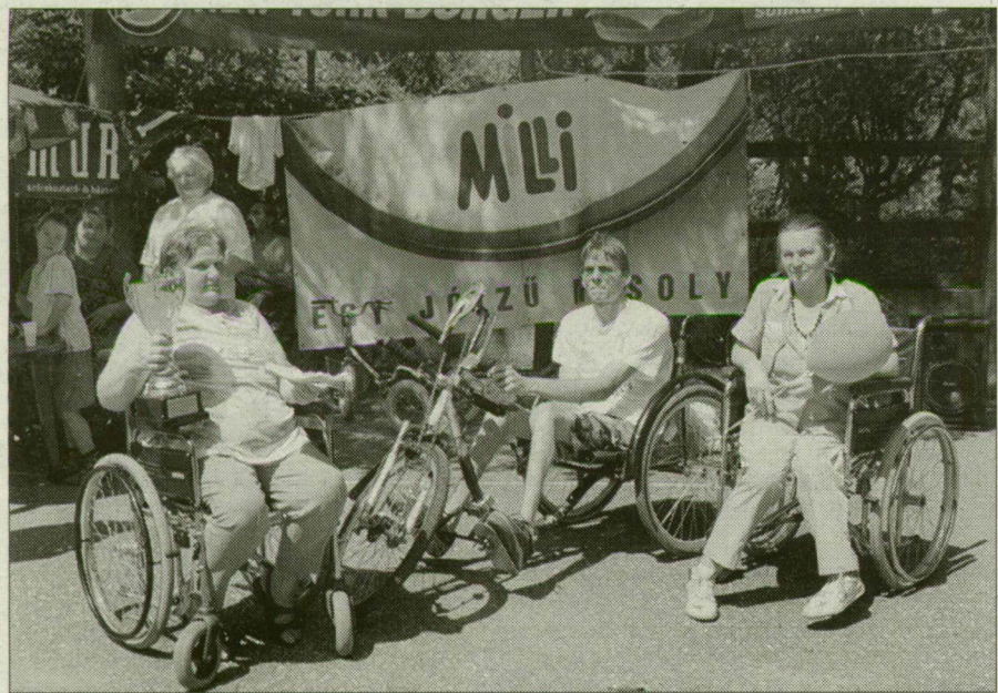
Öt kategóriában mérték össze ügyességüket a mozgáskorlátozottak.