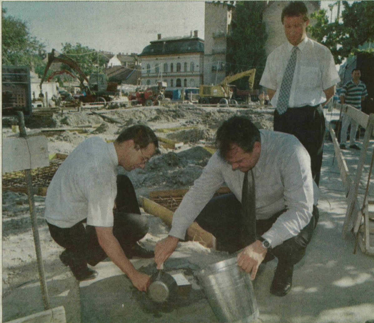
Munkában Glattfelder Béla (balról) és Bartha László. Az alapkőbe rejtett urnába a dokumentációkon, s a Délmagyarország tegnapi számán kívül még aprópénzt is raktak.

A Szent István tér 3-4. szám alatti telken tegnap délután Glattfelder Béla, a Gazdasági Minisztérium államtitkára és Bartha László, Szeged polgármestere rakta le két szomszédos épület, összesen 31 szociális bérlakás alapkővét. Az ünnepélyes eseményt megelőző sajtótájékoztatón elhangzott: a város a beruházás-