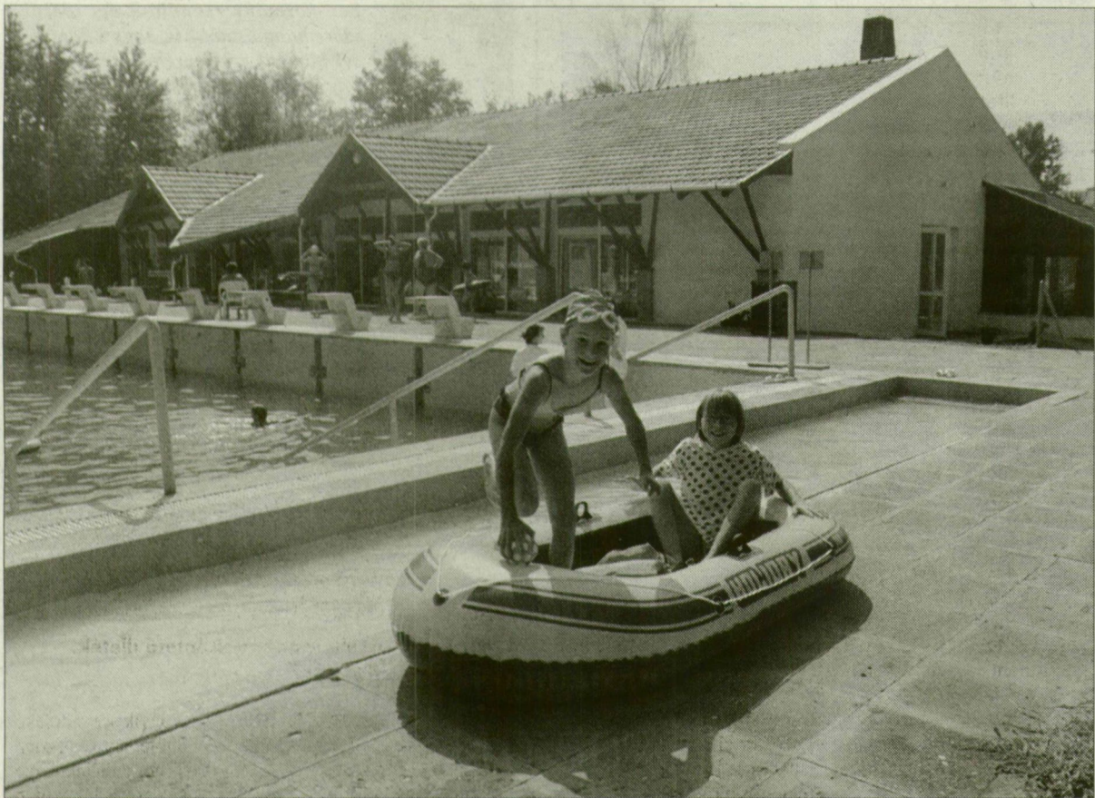
A medencébe vízforgatót építenek.

A mórahalmi városi fürdő fölüjtését és bővítését 82,5 millió forinttal segíti a Gazdasági Minisztérium. A Széchenyi-terv egészség-turizmus-pályázatán nyert pénzből, valamint Phare-támogatásból és önerőből fedezik a 320 millió forintos rekonstrukció költségeit.