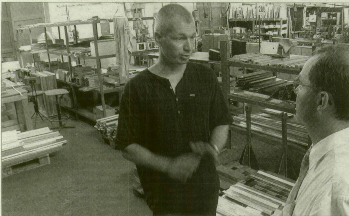
A csongrádi Panol Rt. felszámolója szerint a dolgozók tenni akarása is hozzájárul a cég további életben tartásához

A csongrádi Panol Rt. megmenthető, s erre a közlejtőben megte- remthető az esély – véli a cég felszámolója, Munz Károly. Elmondta, személyes kudarcnak tartaná, ha eddigi felszámolói tevékenysége során a csongrádi részvénytársaság lenne az első gazdasági egység, amelyet a felszámolás végére meg kellene szüntetni.