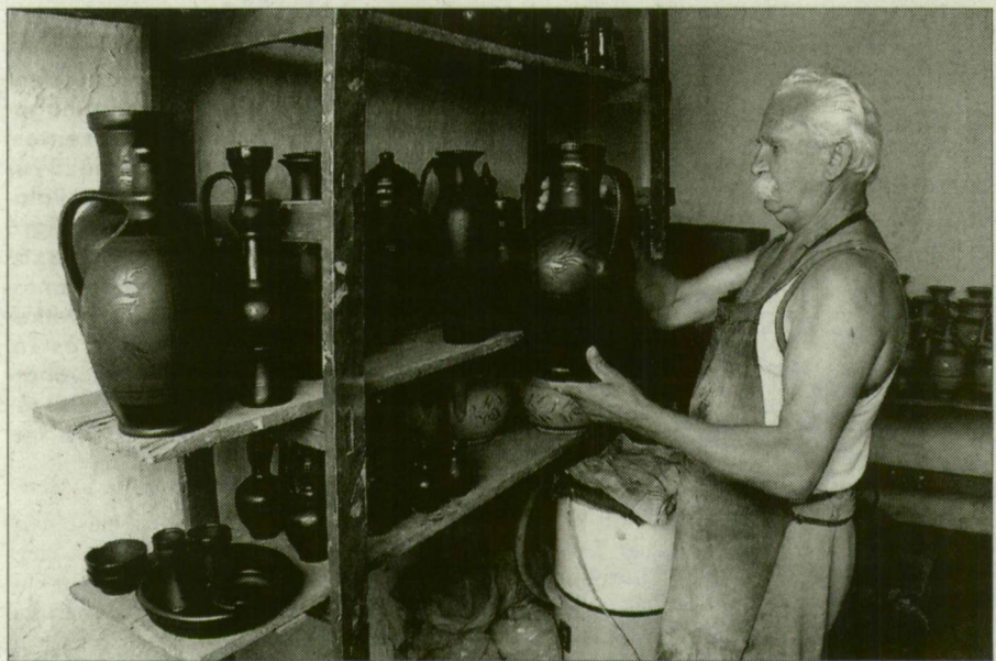
Mostanában már csak szentesi fekete kerámiák készülnek a műhelyben.