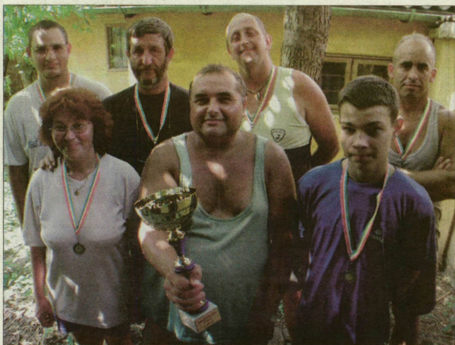
Csapatban a Szegedi Herman Ottó Horgászegyesület együttese nyerte a kupát.