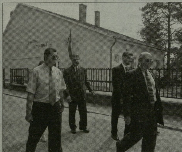
Ahol az információ áramolhat.