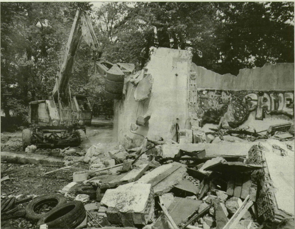
Igy múlik el a Vidámpark dicsősége...

Évek óta kihasználatlan Újszegeden a ligeti Vidámpark, ezért egy közalapítvány támogatásával sport- és szabadidőparkká alakítja át a város vezetése. A munkálatok már egy éve megkezdődtek. Egyébként az egész Liget megújul, de nem legutóbbi formájában, hanem az 1858-ban, báró Reitzenstein Vilmos ezredes által megálmodott és katonáival kialakított ligetre emlékeztetően.