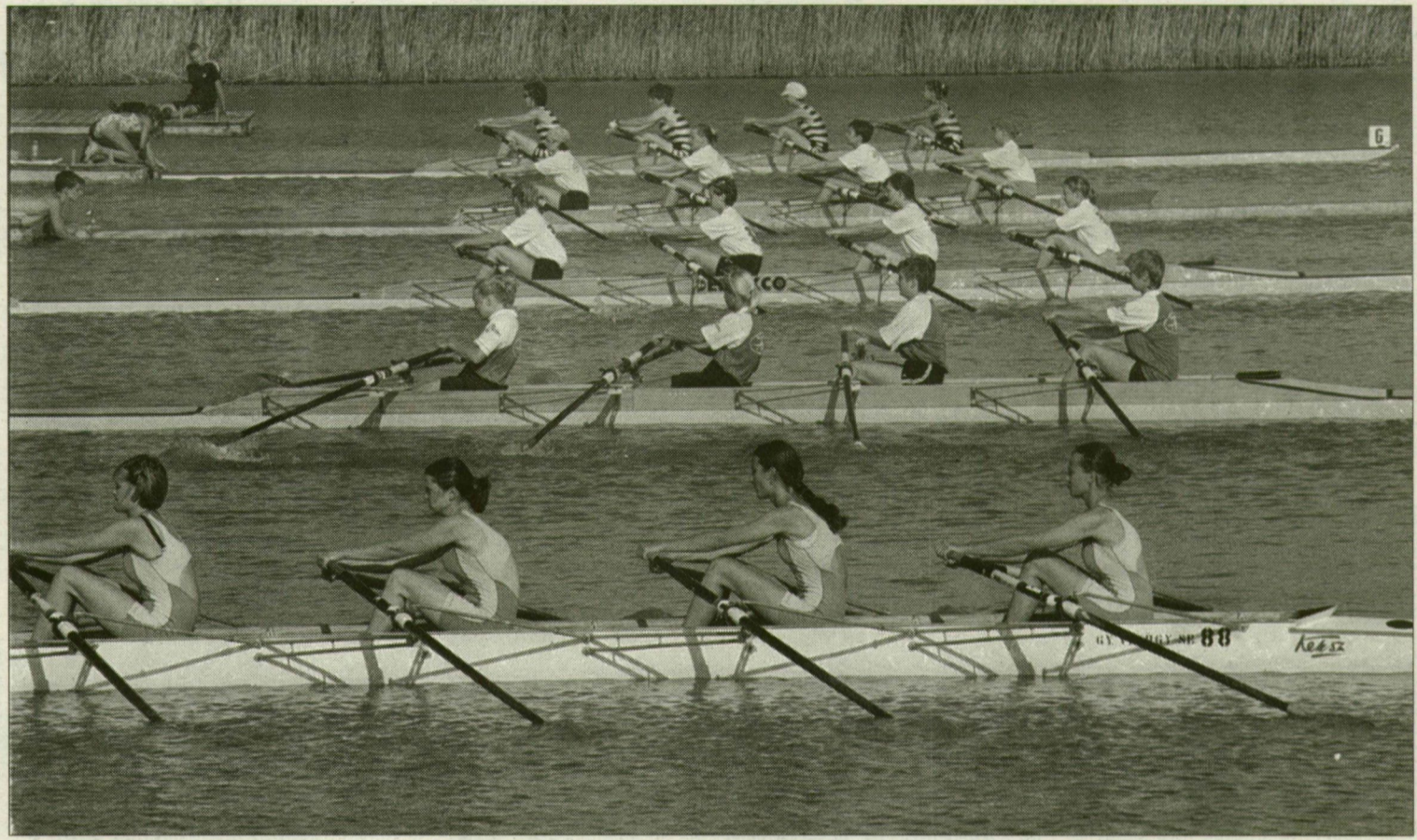
A 102. evezős országos bajnokságon népes mezőny indult a női négy párevezősöknél.