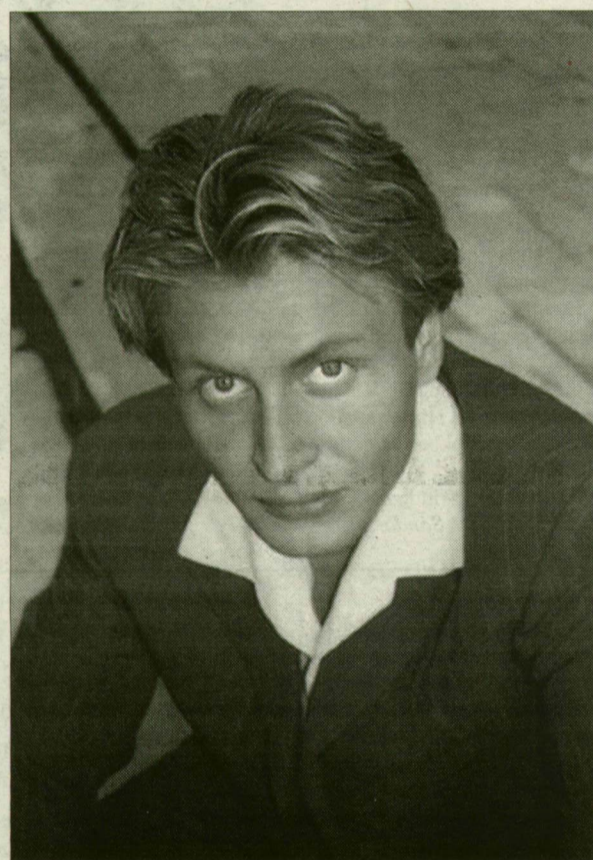
Az orgonista ismét különleges helyen ad koncertet

– A monumentális Bach-művek fantasztikusan szólnak a visszhanggal. Ez a koncert vidámabb lesz, mint a tavalyi,