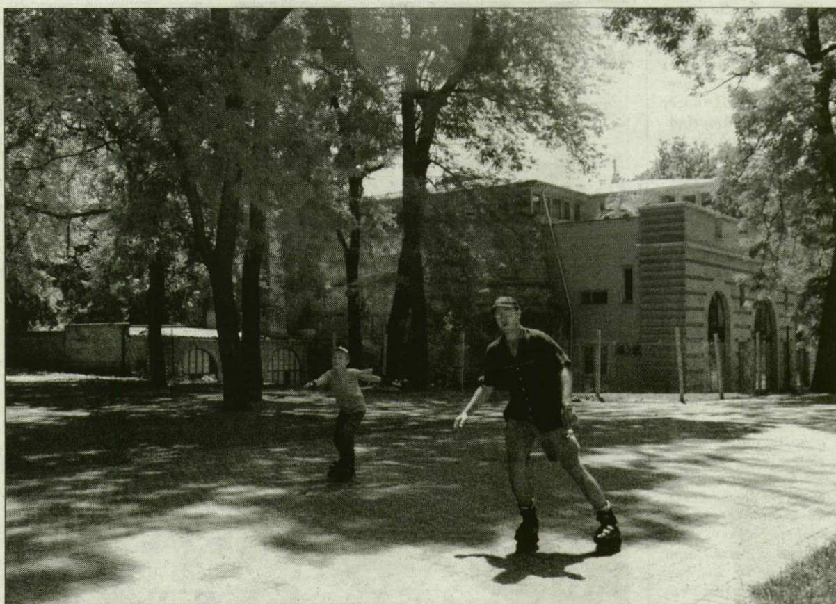
A szegedi vár felújítása sem ment volna pályázati pénzek nélkül.

A szegedi önkormányzat különböző pályázatokon közel 20 milliárd forintot nyert fejlesztésekre, nagyberuházásokra. A hatalmas összeg fele uniós forrás, amelynek segítségével készül el 3-5 év alatt a biológiai szennyvíztisztító, valósul meg a csatornázás, valamint a regionális hulladékgyűjtés programja.