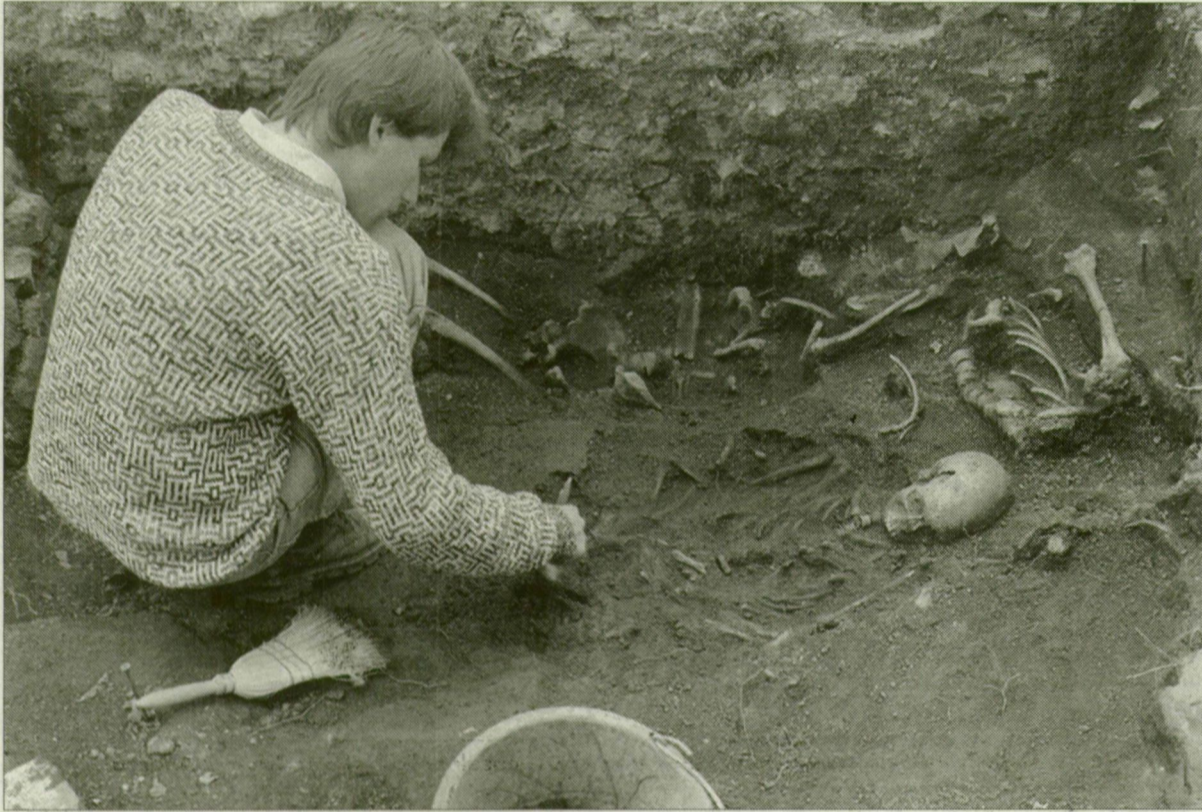
Ásatás a szegedi várkertben, 1999-ben. A csontokban megőrződött örökítő anyag sok mindent elárulhat a tudósoknak.

A honfoglalás korában a Kárpát-medencében élt népek, s az ide érkező magyar törzsek származására, rokoni kapcsolataira próbálnak fényt deríteni az MTA Szegedi Biológiai Központjának, illetve Régészeti Intézetének kutatói. A következő négy év alatt összehasonlító genetikai módszerrel folytatandó vizsgálatokra állami támogatást kaptak a tudósok a Széchenyi-terv egyik programjában.