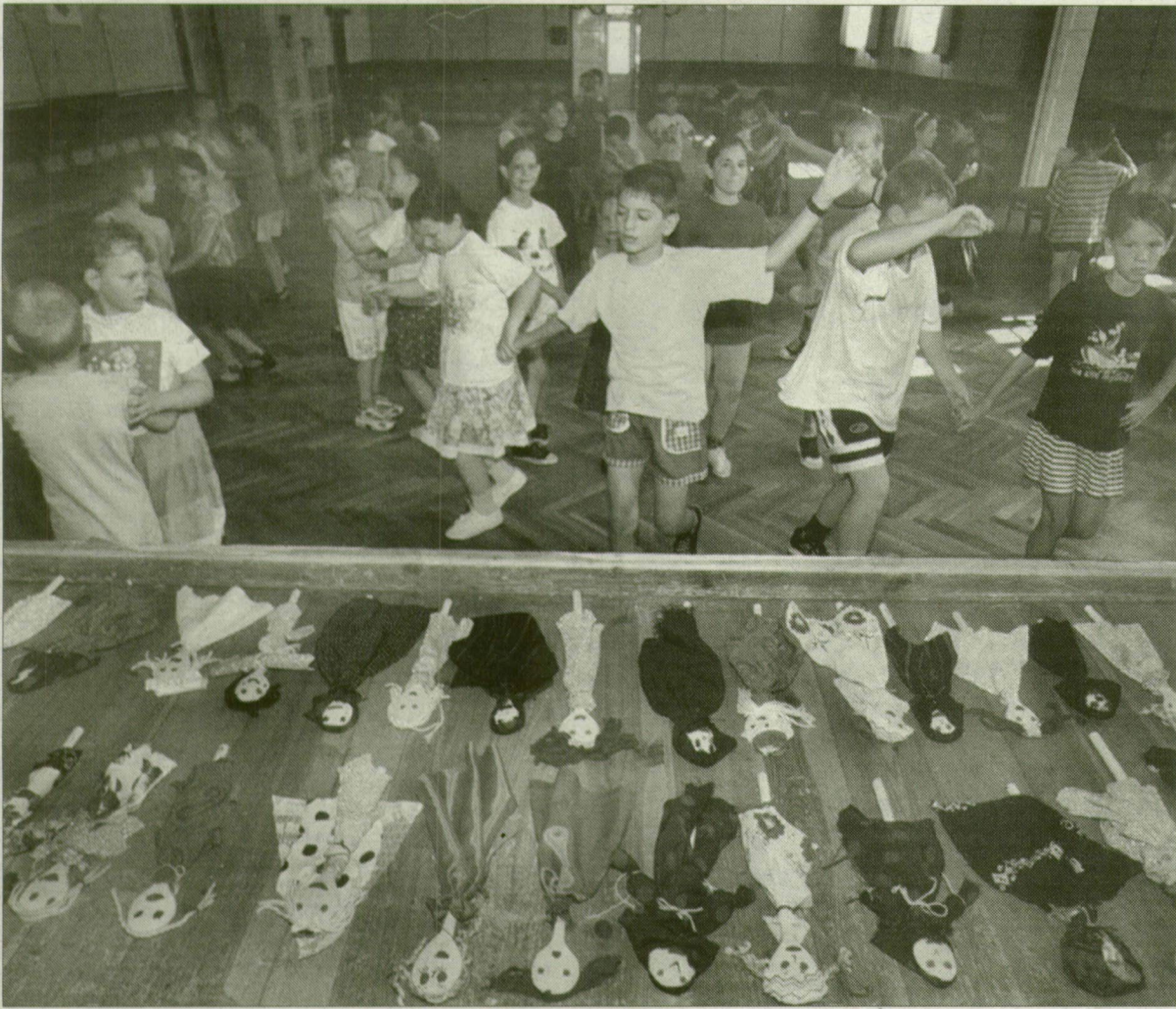
Együtt mindig könnyebb. Kezdő lépések a haladó táncosoknál.

Egy hétig tartott a Szeged Táncegyüttes Alapítvány röszkéi néptánc tábora, ami tegnap, pénteken ért véget. Habina Péter igazgatótól megtudtuk, 110 gyermek vállalta, hogy az évi rendszeres tánctanulásra – amelyet év közben heti két iskolai órában sajátítanak el – még egy hét ráadás legyen. Táncepedagógusok irányításával