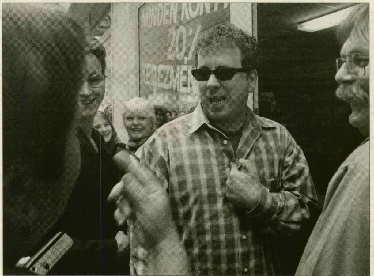
Nem kétséges, hogy ki a jelöltje Friderikusz Sándornak az elnöki posztra.

Az elmúlt héten valószínűleg bombaként robbant a hír, hogy a Magyar Televízió elnöki székére kiírt pályázaton – másik három jelölt mellett – a népszerű tévésztár, Friderikusz Sándor is elindul. Lapunk megkereste Friderikusz, hogy a hír részleteiről érdeklődjön.