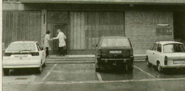
A rendelő falán eltüntették a repedéseket, a homlokzat újra ép.

Többször adtunk hírt arról, hogy megroggyant a Korondi utcai rendelő, s több éven át válságos helyzetben volt az épület A falak megrepedtek, a szennyvíz az épület alatt gyűlt össze, a rendelő alsó szintje rendszeresen beázott, a ház süllyedt. Az első, az épület válságos helyzetét feltáró statikai vélemény közel 3 évvel ezelőtt, 1998-ban készült el. Az ott dolgozó orvosok évek óta hiába jelezték az önkormányzatnak a rendelő romlásának tüneteit, nem történt semmi, egészen ez év májusáig, amikor is elkezdődött az újszegedi háziorvosi rendelő helyreállítása, s a megadott határidőre, a napokban elkészült. Már csak az ÁNTSZ vízminta-értékelési eredményére várnak, s várhatóan egy héten belül visszamehetnek régi helyükre a földszinti rendelőkből ideiglenesen elköltöztetett gyermekorvosok.