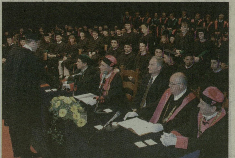
Idén kilencvennyolc gyógyszerészhallgató kapott diplomát. Az ünnepségen Mikola István egészségügyi miniszter (középen) is részt vett.

– Az új egészségpolitika arra irányul, hogy rendet tegyünk sorainkban, és ne sörjünk szőnyeg alá a problémákat – jelentette ki Mikola István egészségügyi miniszter szombaton a Szegedi Nemzeti Színházban, az idén végzett gyógyszerészhallgatók diplomaátadó ünnepségén. A fiatalokat köszöntve, a miniszter felidézte azt a harminc évvel ezelőtti pillanatot, amikor ő vehette át egyetemi oklevelét. – Akkor olyan érzés volt bennünk, amit így lehetne kifejezni: ide nekem az oroszánt is. Nagy lendülettel kezdtek a pályát, és ez a lendület azóta sem fogyott ki belőlünk. Megleltük az örömet ebben a pályában, és azt kívánom, hogy önök is éljék át ugyanezt a lelkiületet – mondta Mikola István, aki a gyógyszerészek felelősségvállalásának jelentőségére hívta fel a pályakezdeők figyelmét.