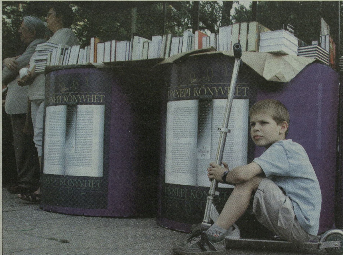
Egy leendő olvasó a szegedi könyvheti megnyitón.