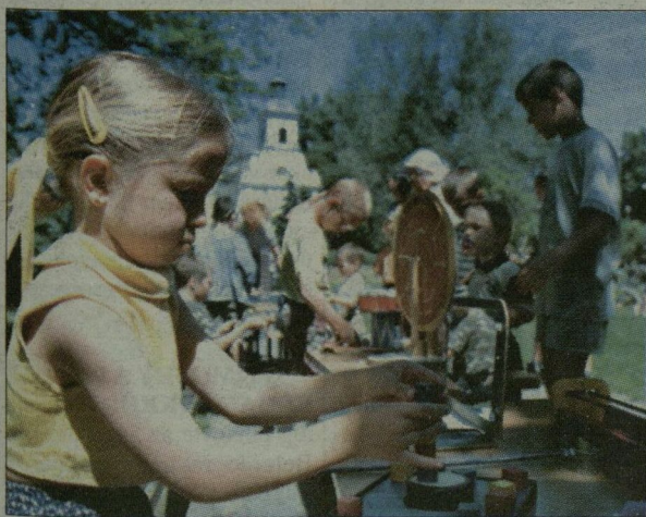
Játék, játék, játék – minden mennyiségben.