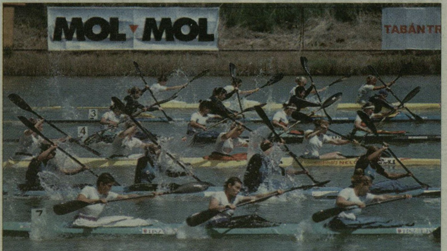
A magyar kajak-kenusok mellett tizenhárom ország legjobbjai lapátoltak a hét végén a Maty-éri Mol-kupa nemzetközi pénzdíjas versenyen.