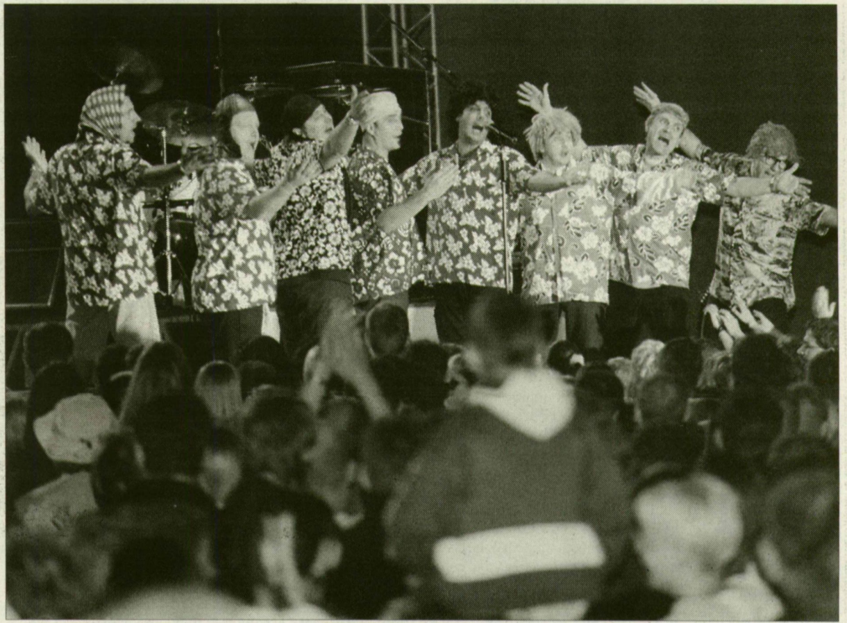
A szegedi fellépésen is sikerült összeállnia a csapatnak.