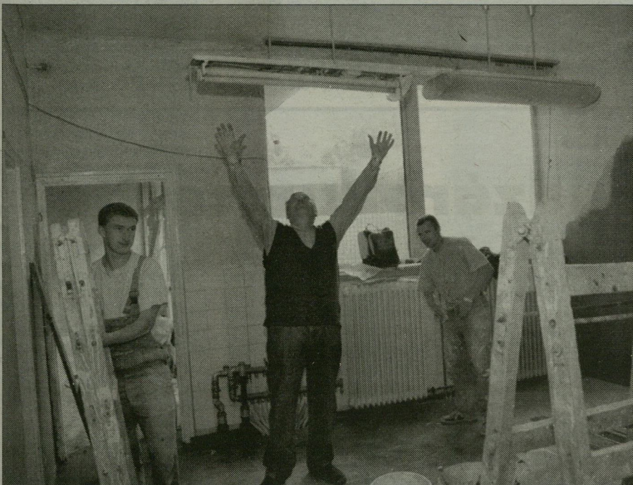
Jól haladnak a felújítási munkákkal.

Rohamtempóban dolgoznak a Korondi utcai orvosi rendelő felújításán: kicserélték a szennyvízelvezetőt, kivágták a túlnőtt gyökereit a járdát megromogató fákat, az alsó szinten, a gyermekváróban pedig már csempéznek.