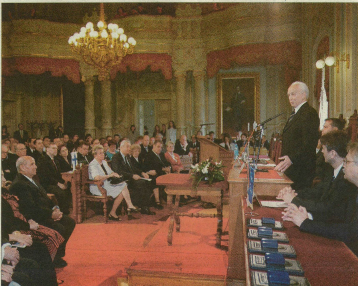
Mádl Ferenc Szeged testvérvárosainak küldötteit is üdvözölhette a díszközgyűlésen.

(Mádl Ferencel készített interjúnk a 3., tudósításunk az 5. oldalon olvasható.)