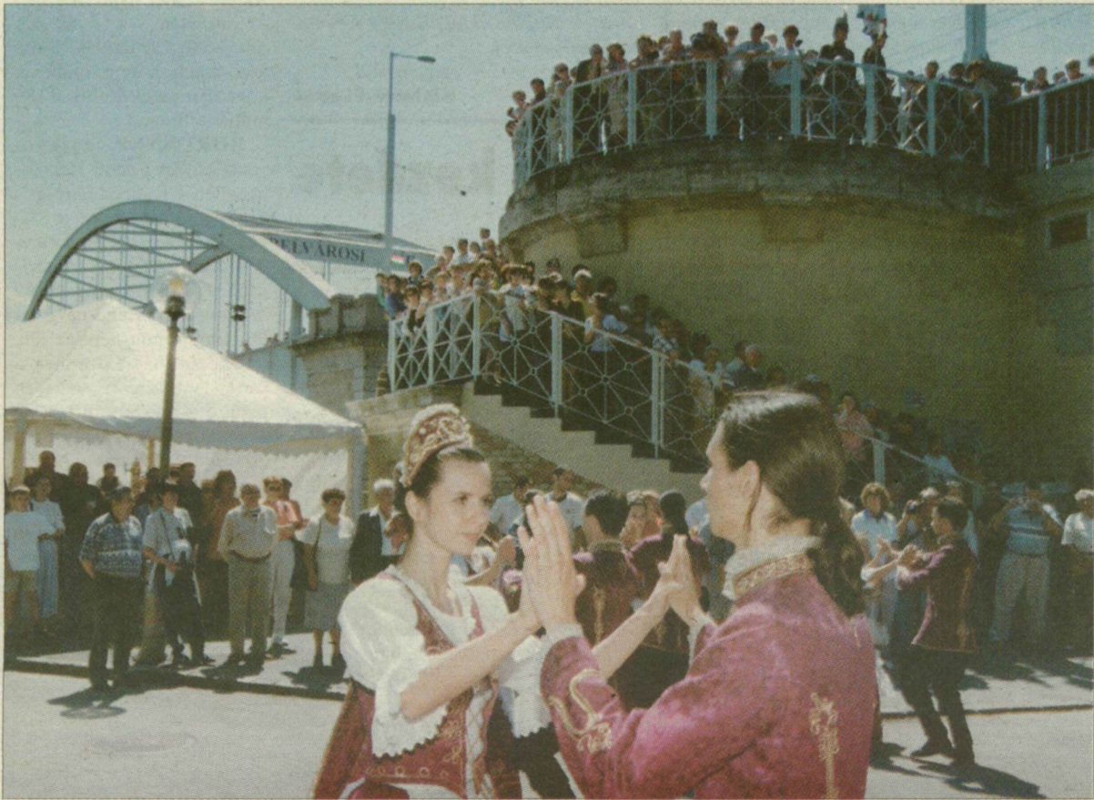
Látványos ünnepséget tartottak a névadó alkalmából.

A városnap ünnepségsorozatának kiemelkedő eseménye volt a hídavatás, amelynek során a régi híd a Belvárosi, az új pedig a Bertalan nevet kapta a keresztelésben. Tegnap egyébként a keresztelő nélkül is a hidak mellett zsongott az egész város. A Móra Ferenc Múzeum lépcsői előtt egymást váltották a színpadon a különböző együttesek, a Roosevelt térről a rakpartra költözött halászléfévő verseny pedig leginkább illatfelhőjével vonta magára a figyelmet. A második híd vásáron az ország legjobb kézművesei árulták mives portékáikat, de a Tisza feletti „setányon” megjelentek a vásári forgatag mellőzhetetlen figurái is: a színes jelmezekbe öltözött, a felhőket zászlókkal kergető gólyalás csepűrágók, népzene-szek és néptáncosok, valamint komédiások és tűzokádók.