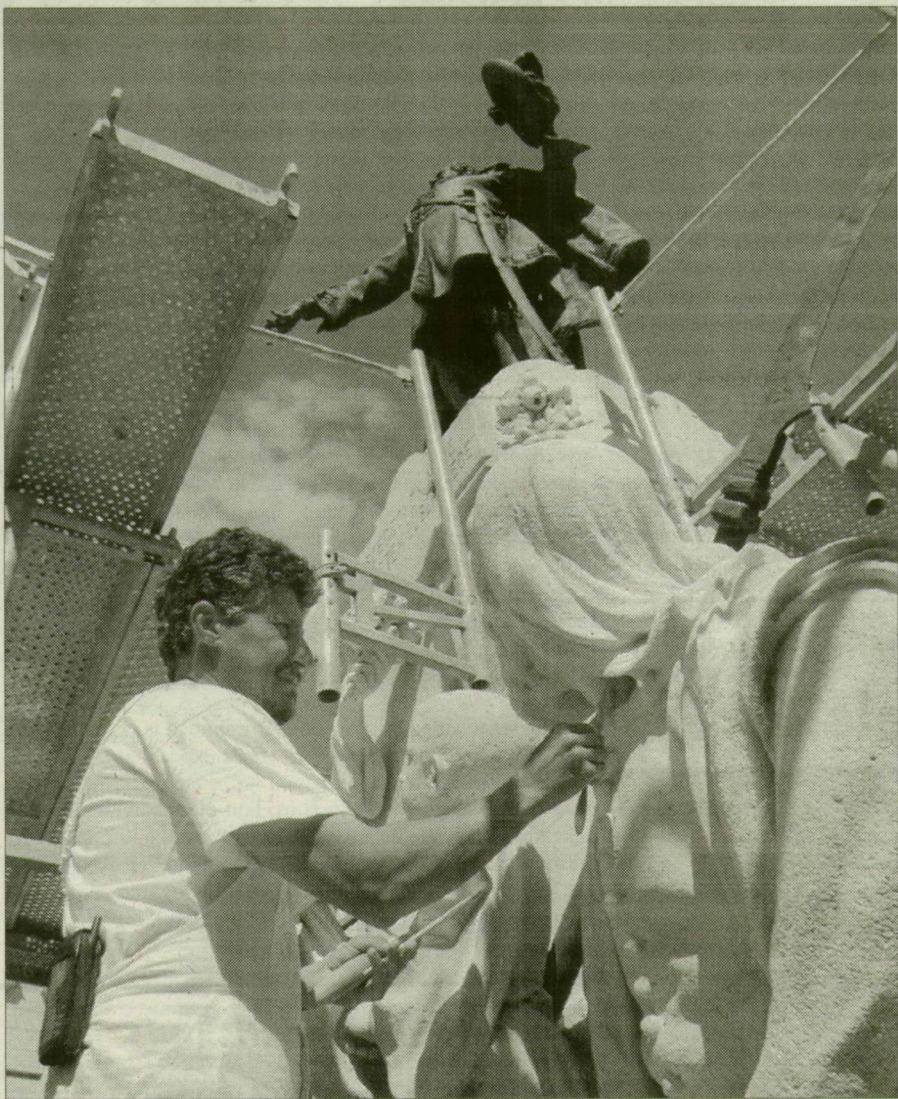
Újraformázzák a letört mészködarabokat.