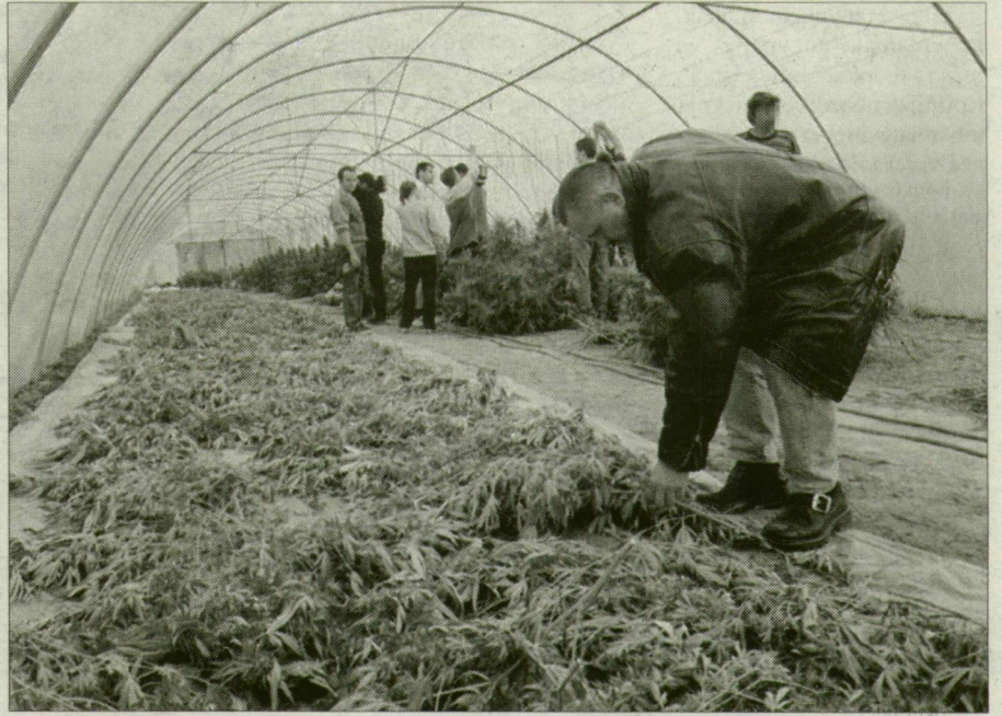
Rendőrök vizsgálják a röszkei kenderültetvényt.