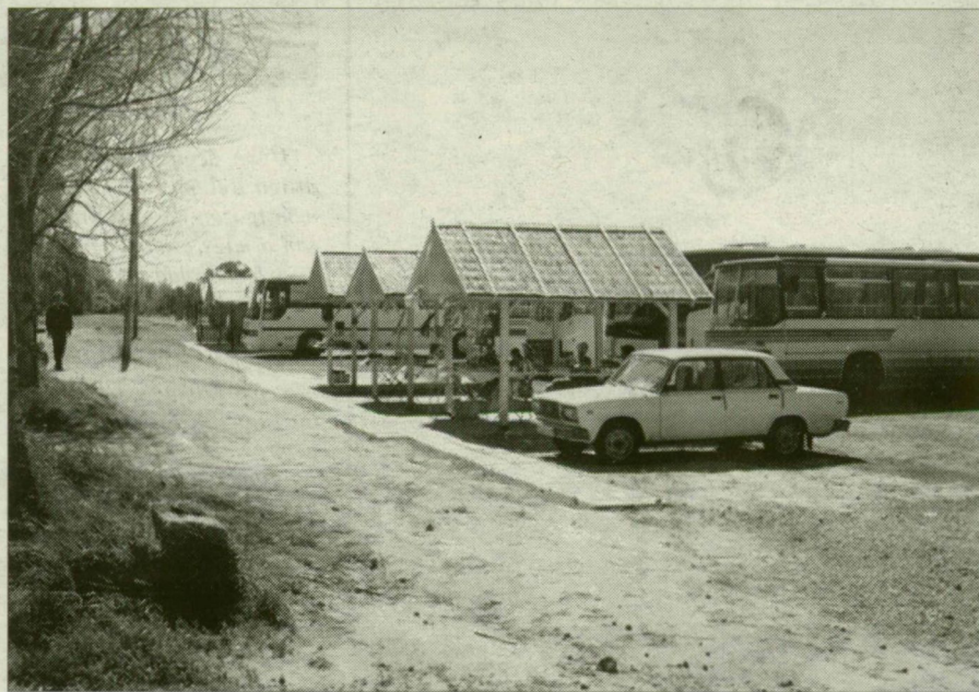
A bérbeadásra szánt földterületet már rendbe tették.

Az Ópusztaszeri Nemzeti Történelmi Emlékparkkal szemben a mintegy ezer négyzetméternyi földszív ideális lehetőséget kínál különböző ajándék-, illetve emléktárgyak árusítására. A kereskedelmi tevékenységet azonban kezdetektől nem nézte jó szemmel a tájvédelmi körzet kezelője, a Kiskunsági Nemzeti Park. A tájba nem illőnek minősítette a pavilonokat. A közigazgatási és jogi procedúrák azonban hosszadalmasak. Az elárusítókhoz tovább működtek, míg tavaly nyár végén a tűz martalékká nem váltak. A megélhetésükért küzdő kereskedők máig nem törődtek bele, hogy véglegesen megtiltsák számukra az árusítást. Mint Makra József, Ópuszt-