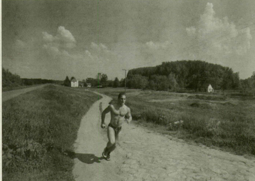
A vitatott terület. Értékes juhszél