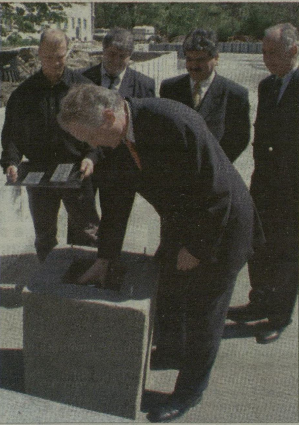
Mikola István egészségügyi miniszter rakta le a diagnosztikai tömb alapkövét.

A közel 130 éves, pavilon rendszerben épült szentesi kórház alaposan rászolgált a rekonstrukcióra. A térség százezer lakójának javulnak majd az életben maradási esélyei, ha felépül a diagnosztikai és sürgősségi tömb. Mikola István egészségügyi miniszter rakta le tegnap a 3600 négyzetméter alapterületű létesítmény alapkövét, és ezzel hivatalosan is elkezdődött az 1,3 milliárd forintos beruházás kivitelezése. A sürgősségi osztály a tervek szerint 2003 első negyedévtől szolgálja majd a térség lakóinak ellátását. A szaktárca vezetője sikerfutamnak nevezte, hogy a szentesiek elnyerték a jelentős állami támogatást. A megyei közgyűlésben és a térségi országgyűlési képviselői között követésre méltó konszenzus született, s ennek