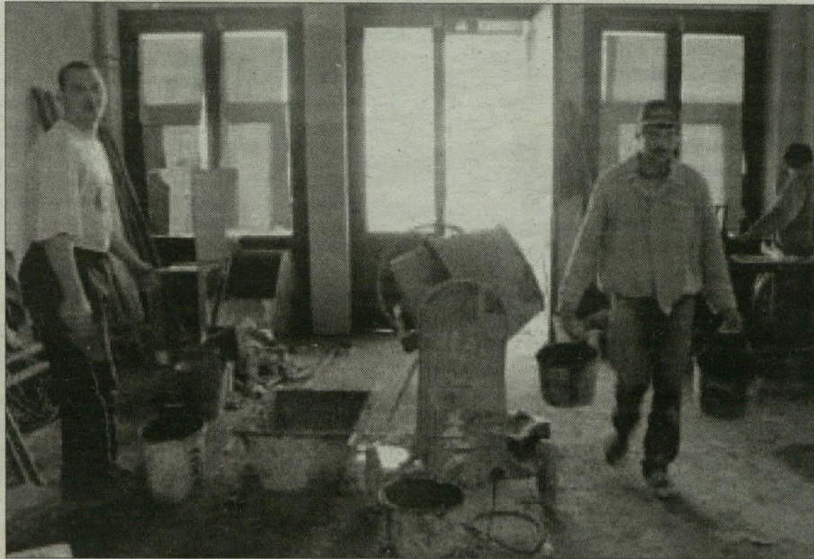
A Kis Virág belülről. A kép magáért beszél.