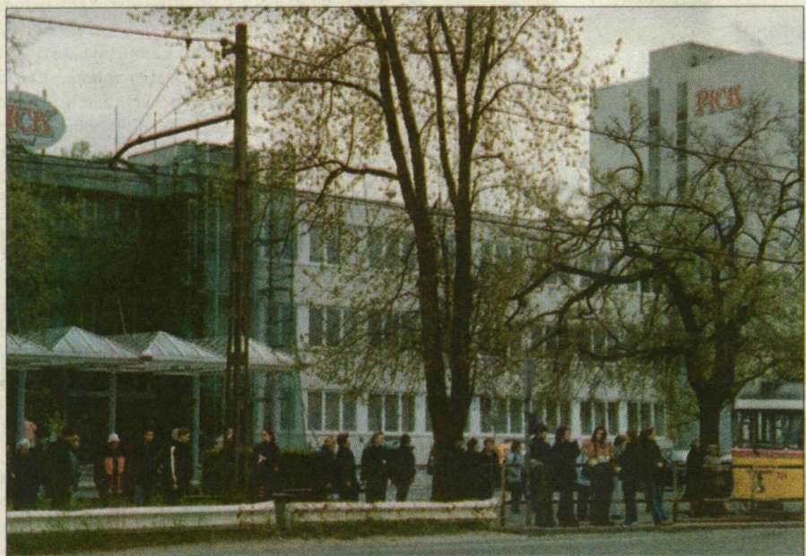
Felállványozott Pick-központ. A megszorító intézkedések között az elbocsátások is szerepelnek.

Eközben – talán éppen a Danone-ügy kapcsán – felerősödött a szóbeszéd, hogy a Pick bezárja a Ringa győri egységét. A Ringa hétfői éves rendes közgyűlésén erről ugyan nem volt szó, az viszont tény, nemrégiben megváltak a vezérigazgatótól, s hétfőtől már nem Vá-