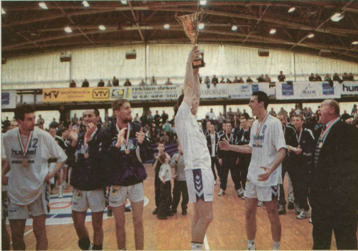
A Magyar Kupán az újszegedi sportsarnok fényei csillannak. Az öröm pillanatai leírhatatlanok, a kép önmagáért beszél...

Dánok és angolszászok pályáznak a szegedi reptérre