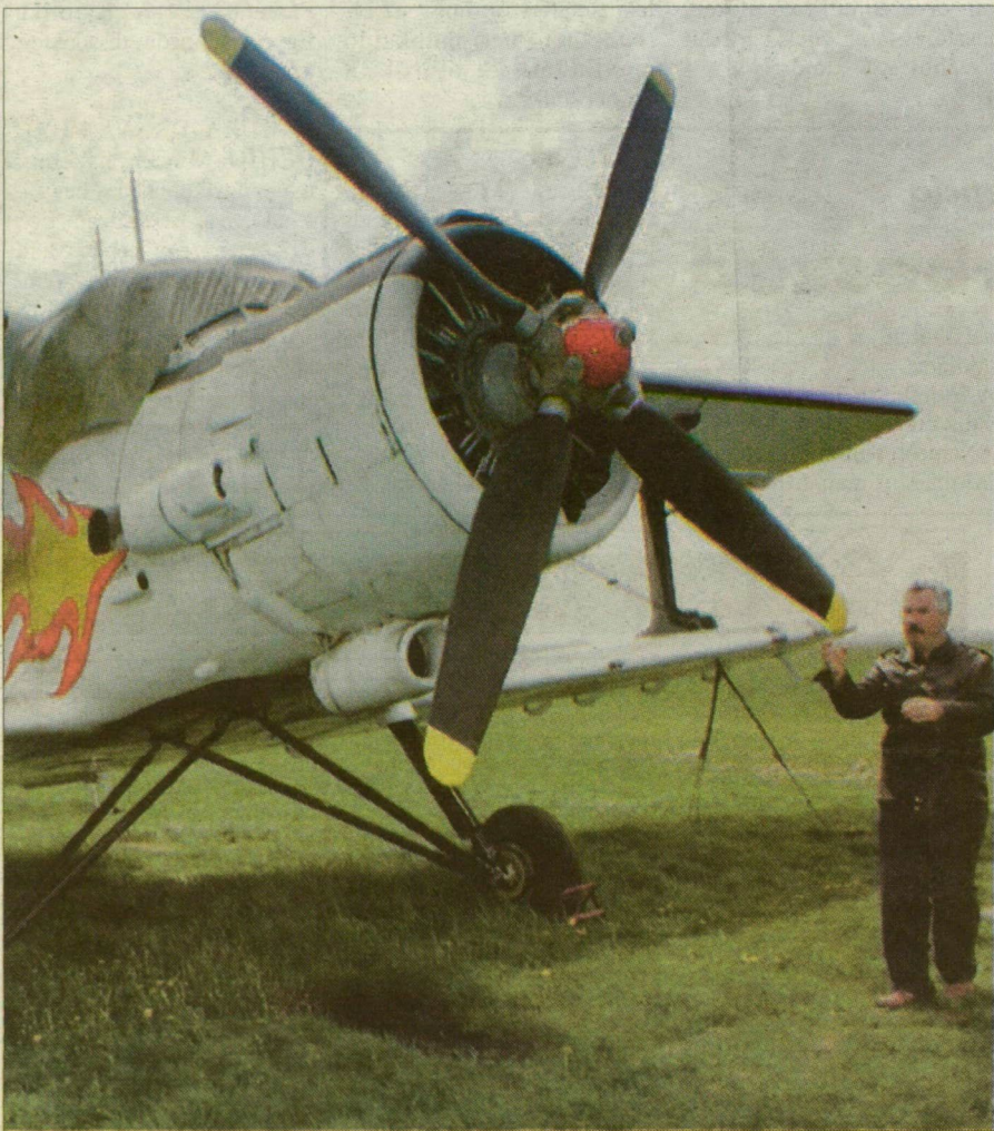
Végre lendületet vesz a reptér ügye?