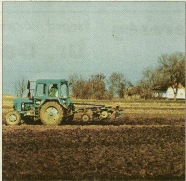
Szántás. Sok helyen csak a tárcsázásra volt pénz.