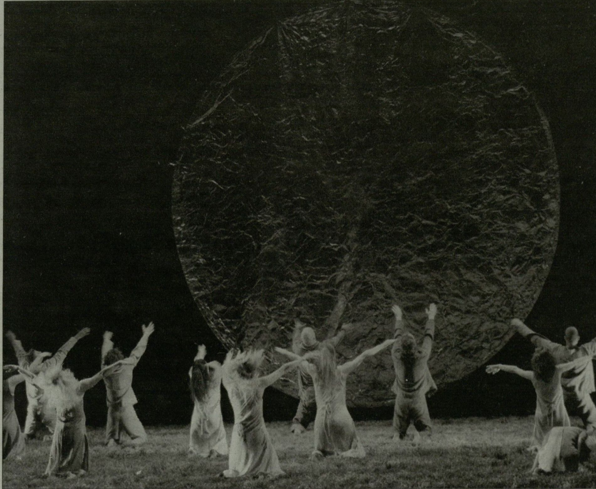
„Jöjj, Nap fénye, melegíts...” Jelenet az előadásból