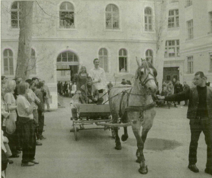
A hagyományoknak megfelelően lovas kocsin érkezett meg a királylány, akinek kezéért a juhász versenyre keltek egymással.

évre trónra ülő uralkodó inge. A püspök időnként elfelejtette a szöveget, s a király is el-elnevette magát. A királlyal avatást követően egymás után bemutatkozott az a tíz jelölt, akik a csillagszemű juhász címet versengenek egymással. A fiatalok egyebek mellett megküzdöttek egy medvebunda öltö testnevelés szakos hallgatóságot, számár háttérre pattannak, kezüket hátréteve fakupából bort isznak, valamint Kukorica Jánosként megpróbálják kicsalni Iluskát a patakából.