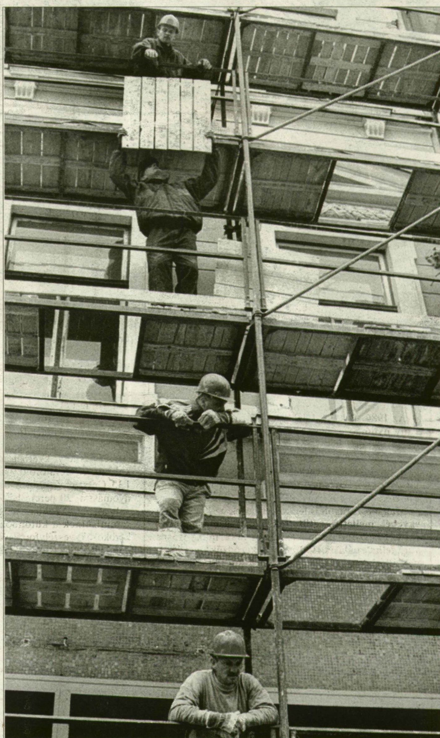
Egyre magasabbra. Felszálló ágban az építőipar.

Az építetők köre csak igen lassan módosul, a '90-es években sokáig szinte kizárólagos lakossági építkezések mellé újból csatlakoztak az önkormányzatok és –