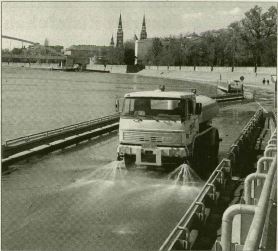
Az aszfalt már száraz, az útszerkezet még nem.

Néhány napon belül a közúti forgalom előtt is megnyílhat a szegedi rakpart. Hiába húzódott le róla a víz, egyelőre még várni kell az útszerkezet kiszáradására, teherbíró-képességét csak ekkor nyeri vissza az útpálya.