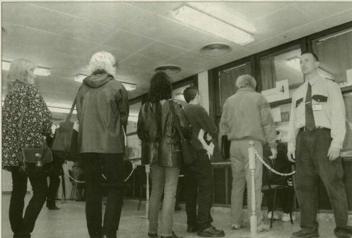
A reggeli tolongásban gyakran van szükség a biztonsági szolgálat jelenlétére is.

Tavaly november 3-tól a vállalkozó igazolványok kiadását, idén januártól pedig a gépjárműforgalmik ügyintézését is a még mindig ideiglenes helyen, a városi rendőrkapitányság épületében működő okmányiroda végzi. A lakossági panaszok nem csitulnak: hiába költözött el a hivatal a Kiss Ernő utcai, szűk épületből nem gyorsult jelentősen az ügyintézés az ország harmadik legnagyobb forgalmú okmányirodájában.