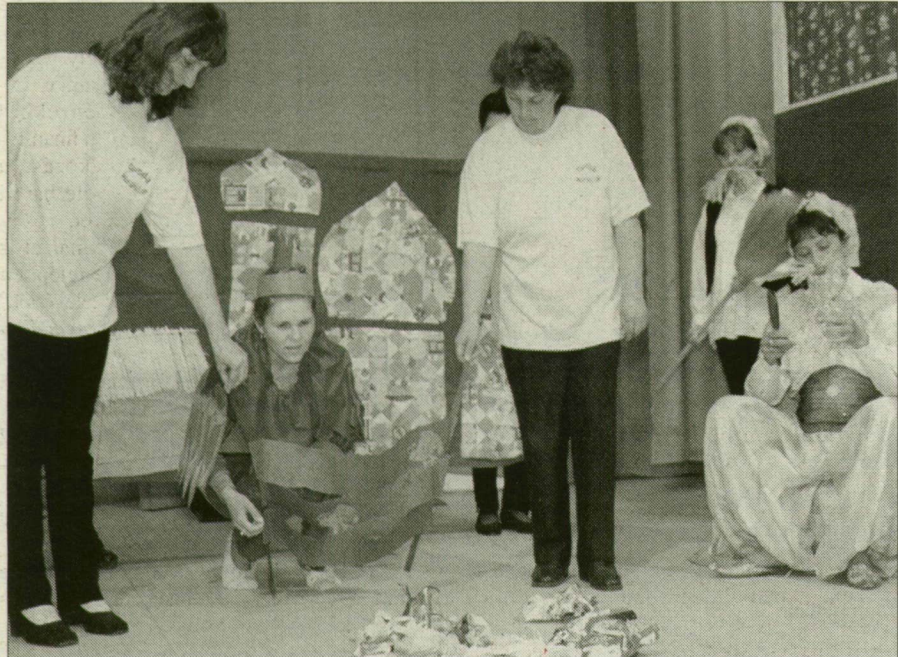
A kiskakas gyémánt félkrajcárja – a mórhalmiak tolmácsolásában.