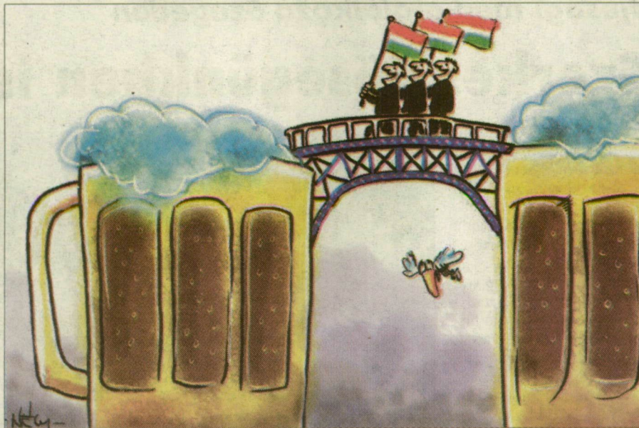
(Németh György rajza)

pálya-építésre. Miközben se közel, se távol nem találtaik olyan országgyűlési képviselő, aki ne ígérte volna az elmúlt tíz esztendőben: az se baj, ha izomlázat kap a nyelve a lobbizástól, de