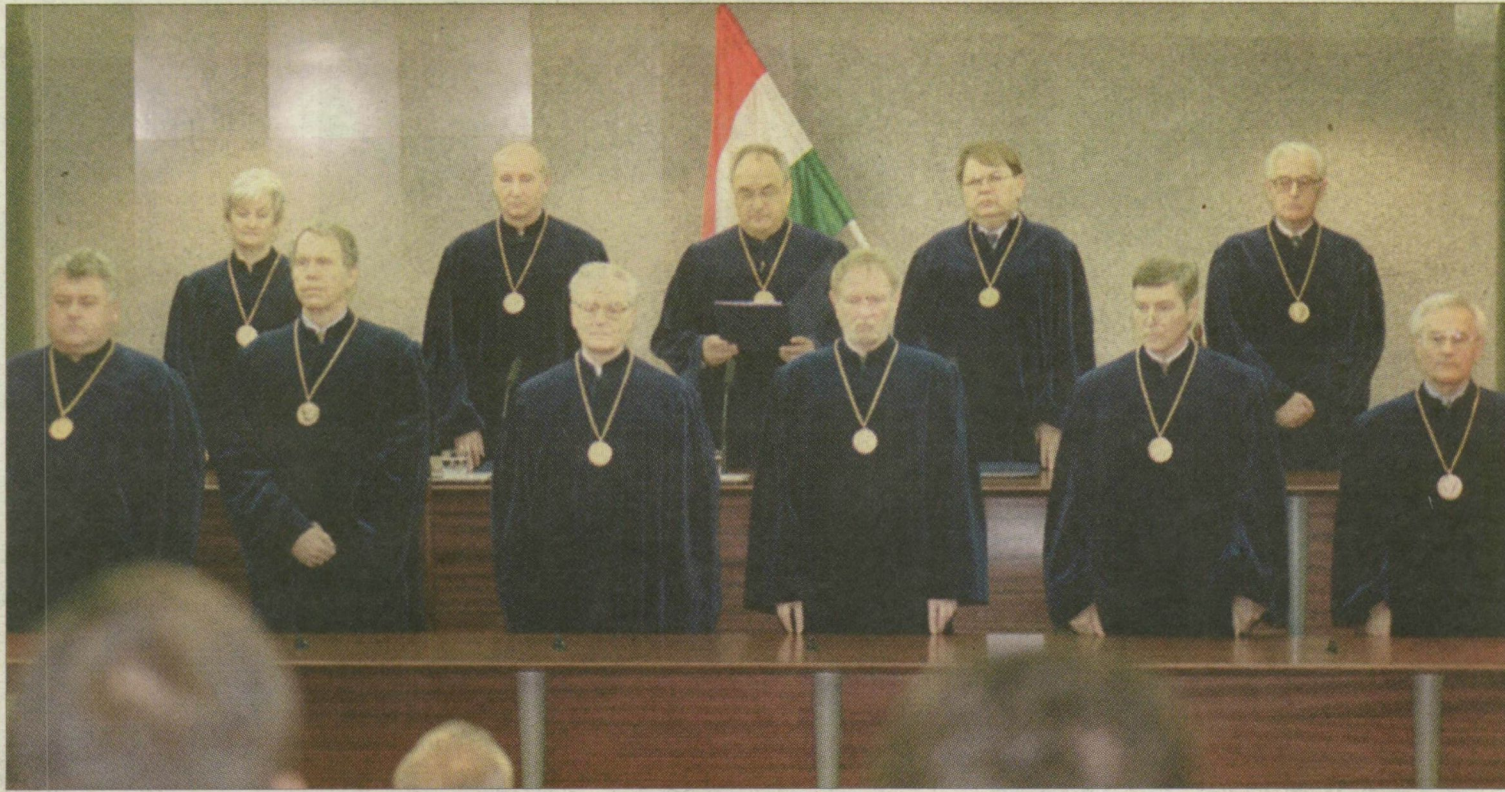
A határozat kihirdetése.