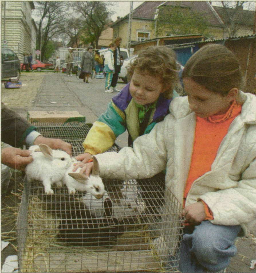
Aktuális akciós hősök: ünnepi gyanútlanóság.