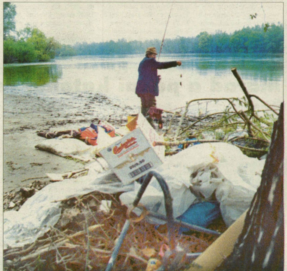
Környezetszennyezés a Sárga üdülőtelepen.