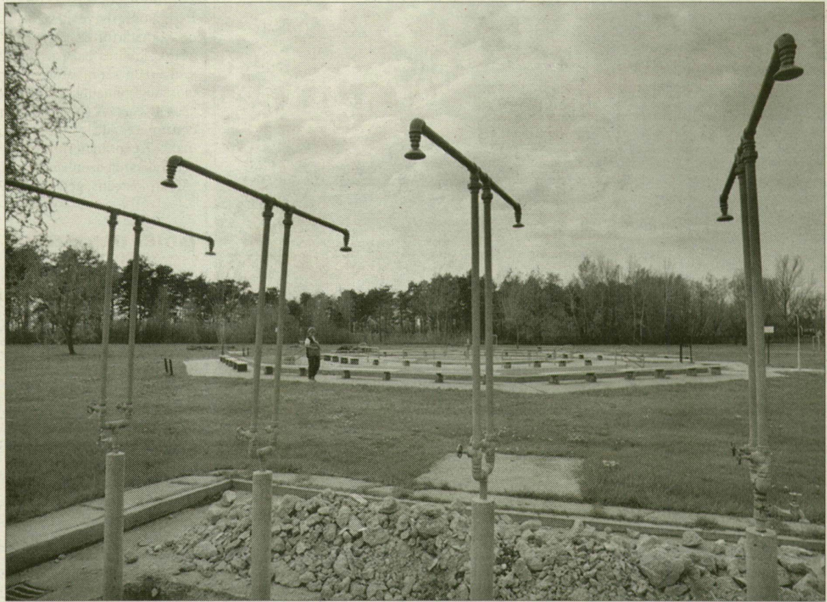
Szikós-tó szezon előtt. A gyermekmedence majd a csúszdaparknak adja át a helyét.

Szikósón jövő májusban Aquapark nyílik. Olyan látványosság, turistaparadicsom, amelynek kedvéért eddig legkevésbé ezer kilométer utazunk különböző a mediterrán országokba. A forrásokat pedig a Széchenyi-terv pályázataival, valamint befektetők teremtették elő. Hamarosan a látványterveket is lapunk rendelkezésére bocsátja a majdani kivitelezést felügyelő Szegedi Fürdő és Hőforrás Kft.