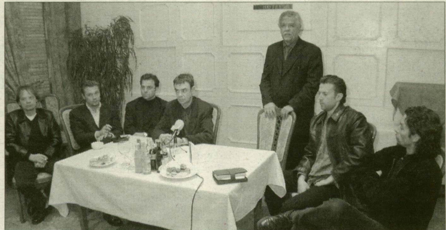
A film alkotói: Novák Emil operatőr, Horkay Péter, Oberfrank Pál, Pruckner Pál, Koltay Gábor, Szarvas Attila és Bicskey Lukács.