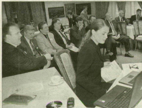
A szegedi nemzetközi konferenciára tizenegy országból érkeztek gazdasági szakemberek és egyetemi tanárok.