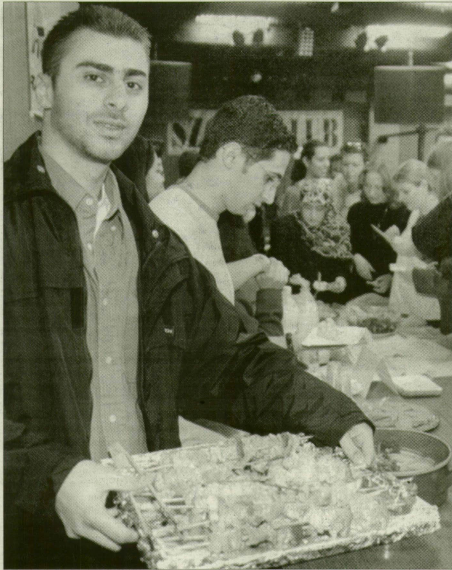
A külföldi diákok bemutatják az indiai, afrikai, arab, kanadai konyha specialitásait.

A szerda alapvetően a sport és a szórakozás napja: délelőtt kezdődik a kispályás labdarúgó- és kosárlabda-bajnokság, a tenisz- és a pingpong-verseny a klinika kertjének pályáin, illetve a Jancsó-kollégiumban. Délután 3 órakor indul a Jancsó-kollégium előtti parkolóban a váltóverseny, melynek keretében a négy futóból is egy kerékpárosból álló csapatoknak meg kell kerülniük a várost. A sportversenyek összefoglalása 100 ezer forint, aki bármilyen motivációt ér az teszmozgásra, az