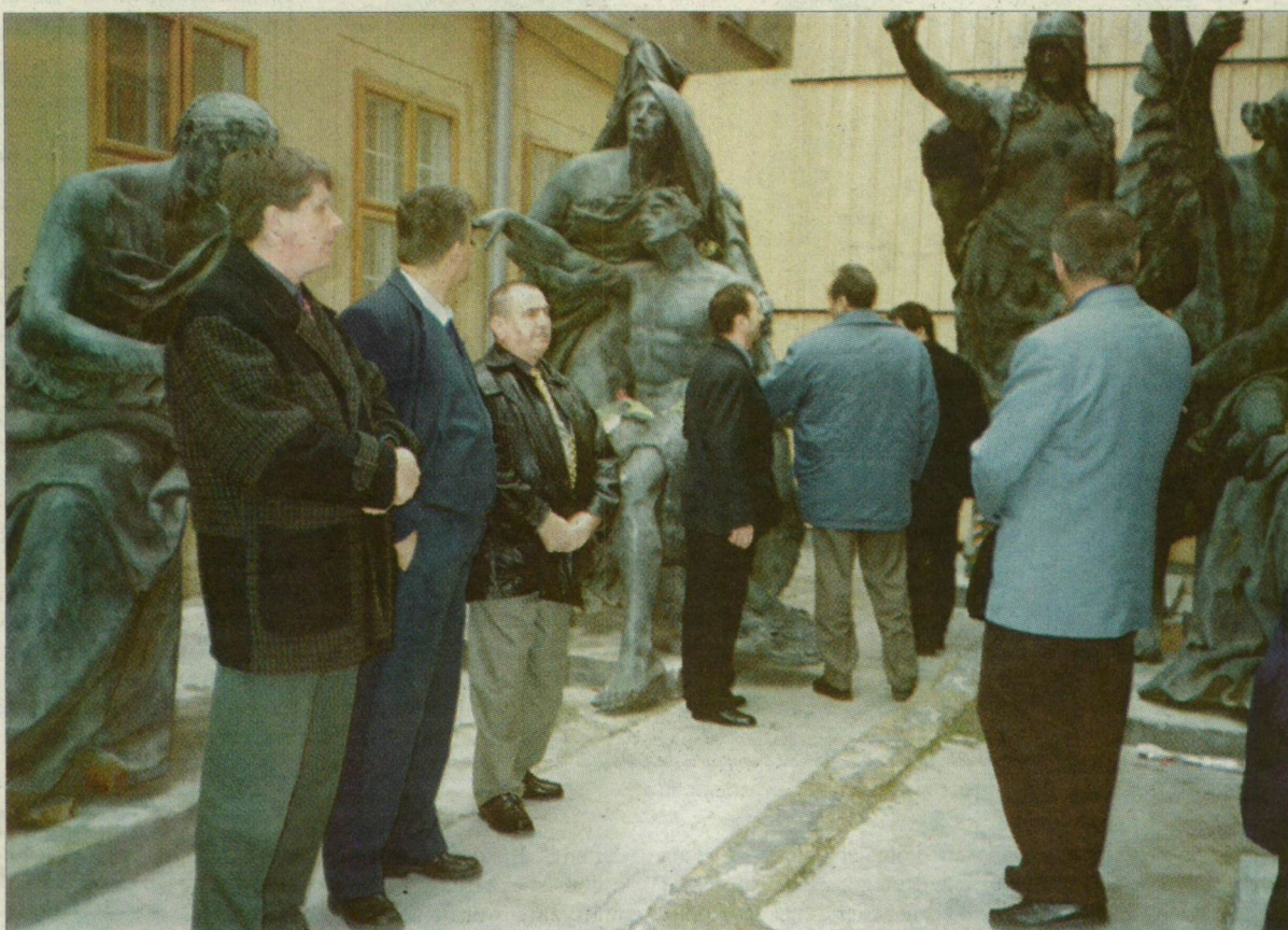
A képviselők megtekintették az aradi Minorita-rendház udvarán lévő szabadságszobor felújításra váró darabjait.

A határon túli szomszédainkkal való jó kapcsolat ápolása nem csupán az ott élő magyarok szempontjából, vagy a régió történelmi hagyományai miatt lehet jelentős, hanem a térség európai színvonalú fejlődésének elősegítése érdekében is. Ezért is alakult meg 1997-ben a Duna-Körös-Maros-Tisza (DKMT) euróregións együttműködés négy román, négy magyar megye, illetve a Vajdaság részvételével. A Phare-CBC uniós támogatás keretében azóta már több sikeres programot kidolgozó magyar-román megyék pedig tovább szeretnék bővíteni meglévő kapcsolataikat. Ennek jegyében volt két napig Arad megye vendége Csongrád Megyei Közgylése. Az Arad Megyei Tanács épületében megtartott együttes ülésen a résztvevők megvitatták az aktuális, közös érdekeken alapuló fejlesztési elképzeléseket. Természetesen olyanokat, amelyekhez segítségért remélhetnek az Európai Uniótól is. A két megye képviselői a stratégia fontosságú feladatok között említették a közlekedési