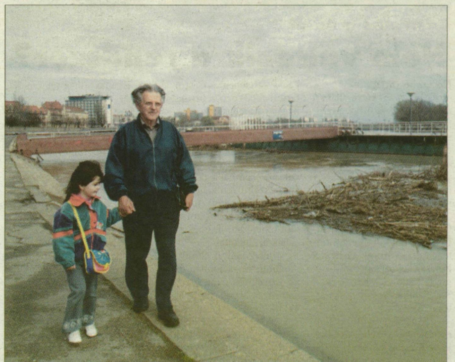
Nagyapa és unoka – kéz a kézben. Ma, holnap, talán még holnapután is sétálhatnak az alsó rakparton, de utána „kilötyten” a víz.