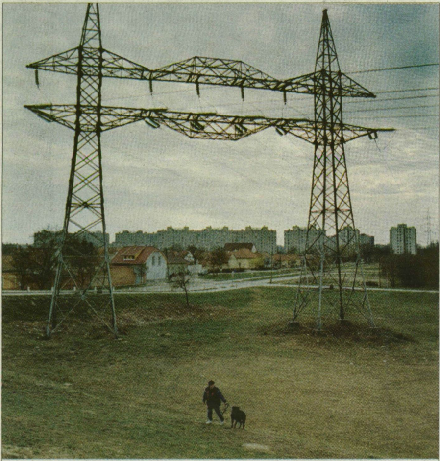
A 19-es választói körzetben élőknek nem kell messzire menekülniük, ha elégük van már Szeged zajából.

Nagy meglepetés éri azt, aki nem igazán ismerős Szegeden, s egy merész kanyarral betere- li autóját a körtöltésnél a József Attila sugárúti négyemeletes panelházak mögé. Ugyanis hi- ába forgatja a fejét, újabb be-