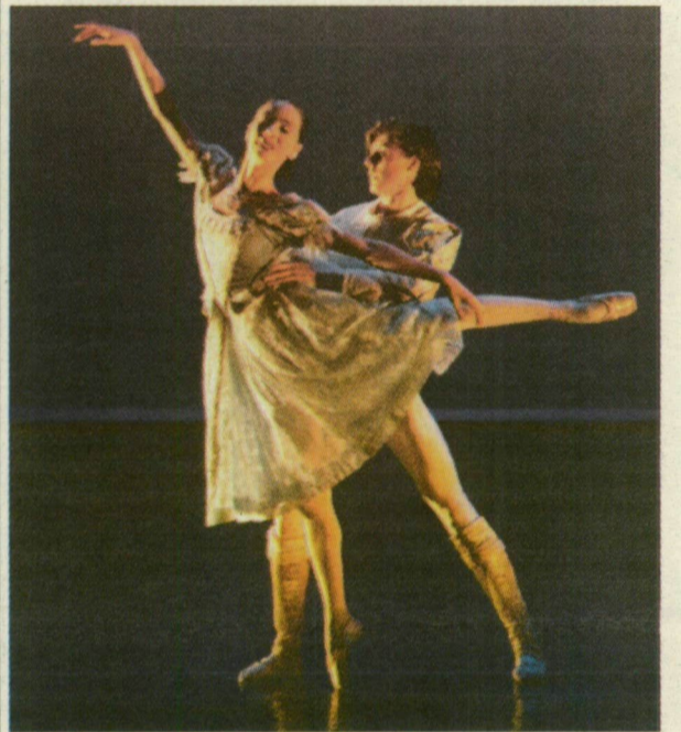
Régen látott klasszikus koreográfia.