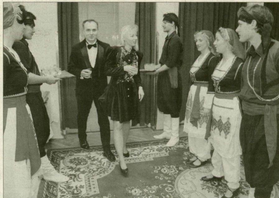
Az Aitosz táncosai fogadják a vendégeket.