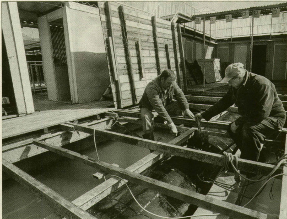
A Szabadság úszóházra közel húszmilliót költenek új tulajdonosai.

Egyesületet, és korlátozott felelősségű társaságot alakítottak a Szabadság úszóház egykori bérlői, hogy megmenthessék a város tulajdonában lévő, teljesen leromlott állapotú vízi alkalmatlanságot. A tulajdonosi jogokat korábban gyakorló, végelszámolás alatt álló Szegedi Fürdő és Hőforrás Kft. ugyanis képtelen volt a három úszóház – a Tisza, a Béke és a Szabadság – illetve a Szöke Tisza hajó sorsát rendezni.