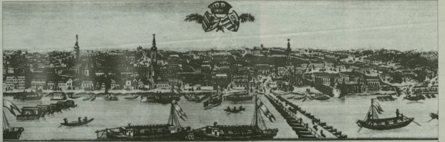
Nemes Szabad Királyi Szeged Városának Banát felől való Tekintete.