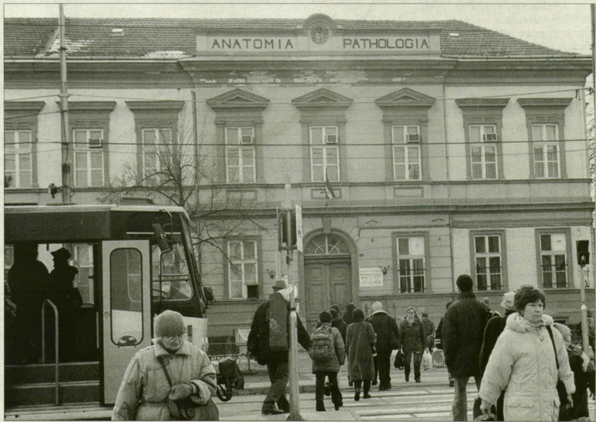
A régi épület, ahol a kórbonctan, az igazságügyi orvostan és az anatómia még együtt van.

– Eddig nem volt annyi pénz, hogy az orvosegyetem e három fontos intézete megszabadulhasson a méltatlan körülményektől. Közeli évszázados „ideiglenesség” után az idén várhatóan elkészül – a régi vasúti hid lábánál – az orvoskar patológia intézetének új épülete, s nyolc évtized után az inté-